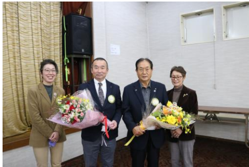
♡美人に挟まれてご満悦のお二人♡