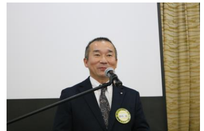
町長表彰受賞 藤枝会員