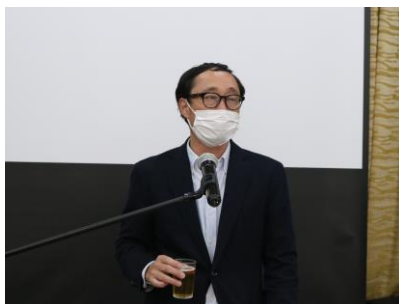
元木次年度会長 乾杯の挨拶