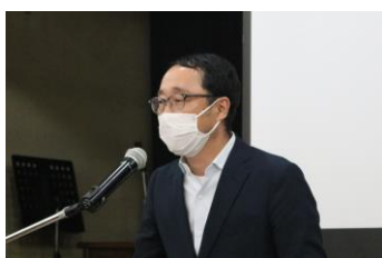
元木次年度会長 乾杯の挨拶