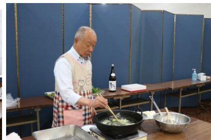
イチチャンの揚げたテンブラ美味しかった