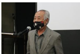
三浦副会長 への挨拶