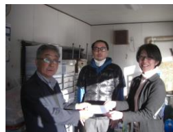
斜里町スポーツ協会