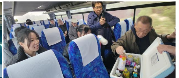
富樫親睦委員長 頑張っています！ 村田会長も???