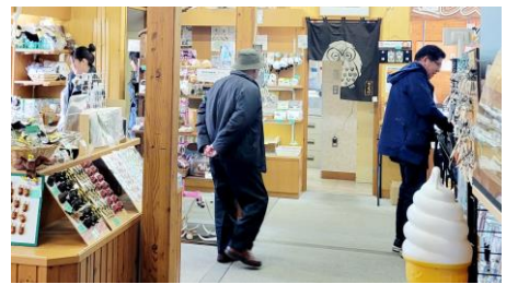
野付半島ネイチャーセンター