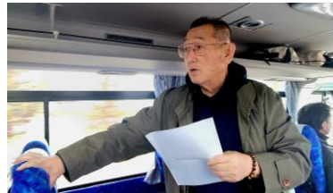
会長しっかりつかまってる