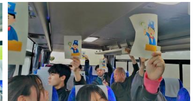
車中で楽しい○×ゲーム