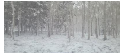
根北峠は一面の雪景色