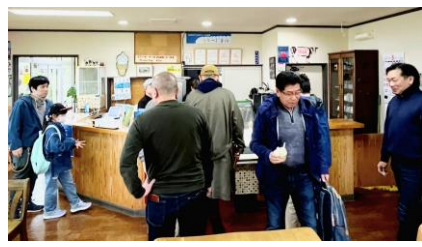
川湯温泉に向かう途中喫茶店で休憩