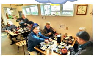
弟子屈 ぼっぼ亭 で昼食

川湯温泉 北海道弟子屈町、阿寒摩周国立公園に位置する川湯温泉。東に摩周湖、西に釧路湖を望む大自然に囲まれた硫黄の香りたちこめる温泉街です。 強酸性硫黄水素を含む明ばん・緑はん泉、日本でも数少ない火山性特有の泉質で、定期的に遠方からいらっしゃる方も多く、療養泉として古くから多くの方に愛されています。特有な泉質と地形環境が体に刺激を与え、自律神経系・ホルモン分泌系の機能を調整して病気を治す力を高めます。 また、飲むとレモンより酸っぱい約Ph1.7の川湯温泉は、五寸釘を1週間ほど落かしてしまふほどの強酸性！その酸が古い角質を溶かしてお肌をすべすべにしてくれる、まさに「美肌の湯」なのです。昨今話題の殺菌効果も実証済み。 【泉質】酸性・含硫黄・鉄(II)・ナトリウム-硫酸塩・塩化物泉(硫化水素型)